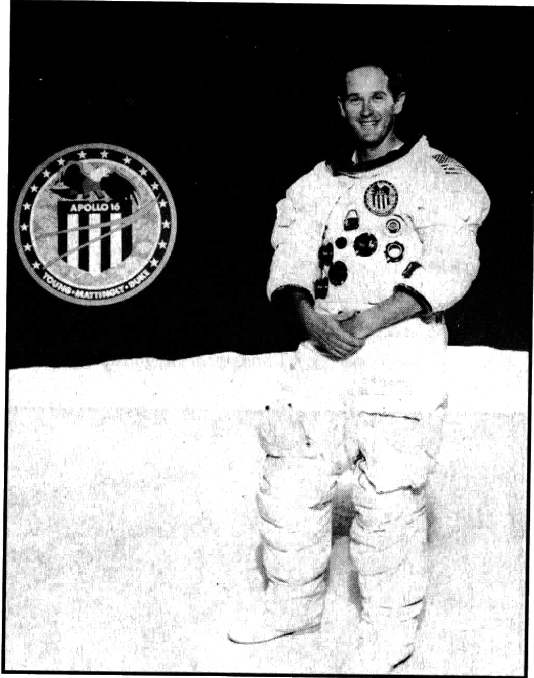
ജേതാവിന്റെ ചിരി: അപ്പോളോ-16 എന്ന ചാന്ദ്രിക പേടകത്തിലുപയോഗിച്ച വസ്ത്രംധരിച്ച ചാർജി